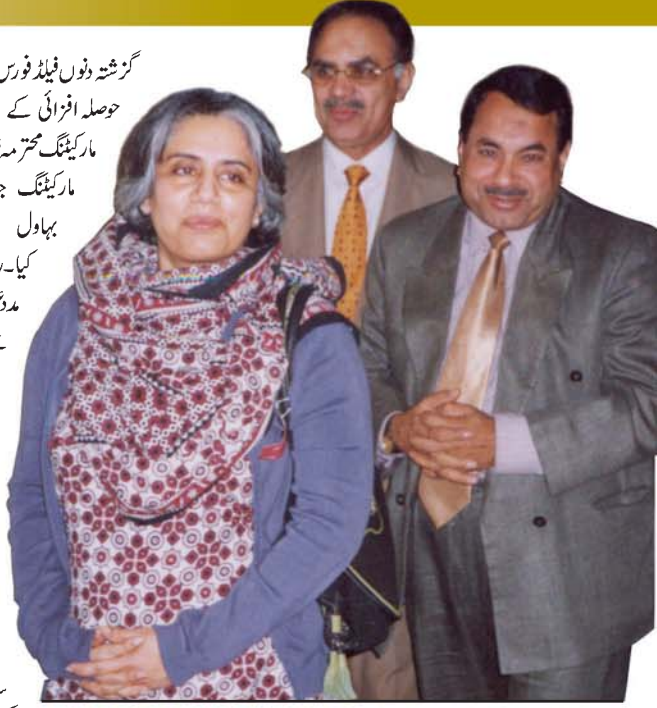
معزز مہمانان، زونل سیکرٹری ہڈ آد پڑھو گوار موڈ میں

ایسی روز بہاول پور زون نے 2006ء کا سالانہ بنیادی پریمیم مکمل کیا تھا۔ مہمان معزز مہمانان، زونل سیکرٹری ہڈ آد پڑھو گوار موڈ میں