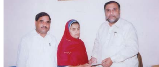
سیالکوٹ زون..... امیر یاٹیجر سید فخر حسین رشوی، سز شہید ایاس کو ان کی والدہ کی وفات پر ڈیٹھ کلیم کی مد میں مبلغ -/1,84,719 روپے کا چیک دیتے ہوئے، تصویر میں سیکرٹری چوہدری ذوالفقار بھی ان کے ہمراہ ہیں