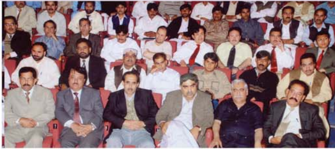
تقریب کے شرکاء

ساتھیوں پر زور دیا کہ وہ وقت اور صلاحیتوں کا بہترین استعمال کریں۔ انہوں نے شرکاء کی توجہ وہاں آویزاں "یہ دنیا صرف کامیاب لوگوں کے لیے ہے" اور "نیا زمانہ نئے صبح و شام پیدا کر" کی جانب مبذول کرائی جس کا جواب زبردست تالیوں کی صورت میں آیا۔ انہوں نے کہا کہ انفرادی محنت سے اجتماعی