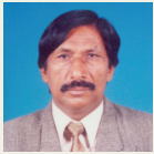
رپورٹ: منشا راہی

آخر میں ادارے کی کامیابی اور ملازمین کی دینی و دنیاوی فلاح کے لیے خصوصی دعا کروائی گئی اور تمام حاضرین محفل میں تبرک تقسیم کیا گیا۔